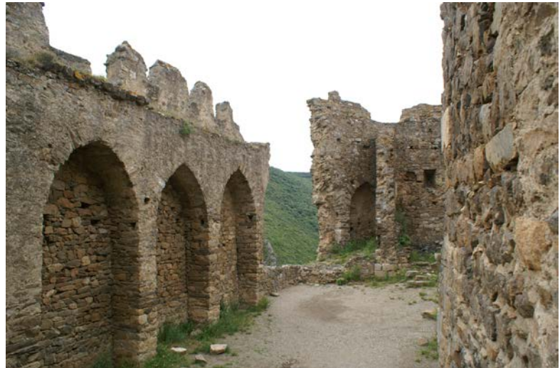
Châteaux de Lastours