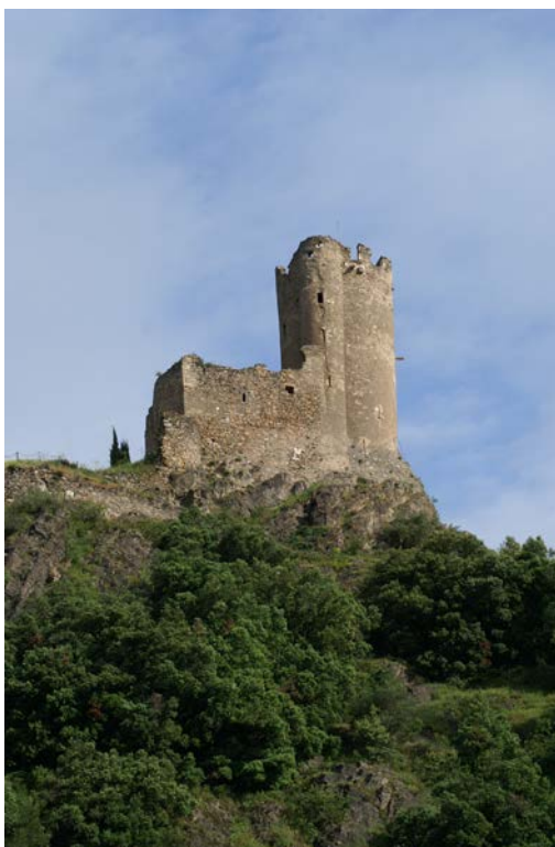
Un des châteaux de Lastours (photo prise par Robert Pétavy lors de notre sortie annuelle du 6 juin)