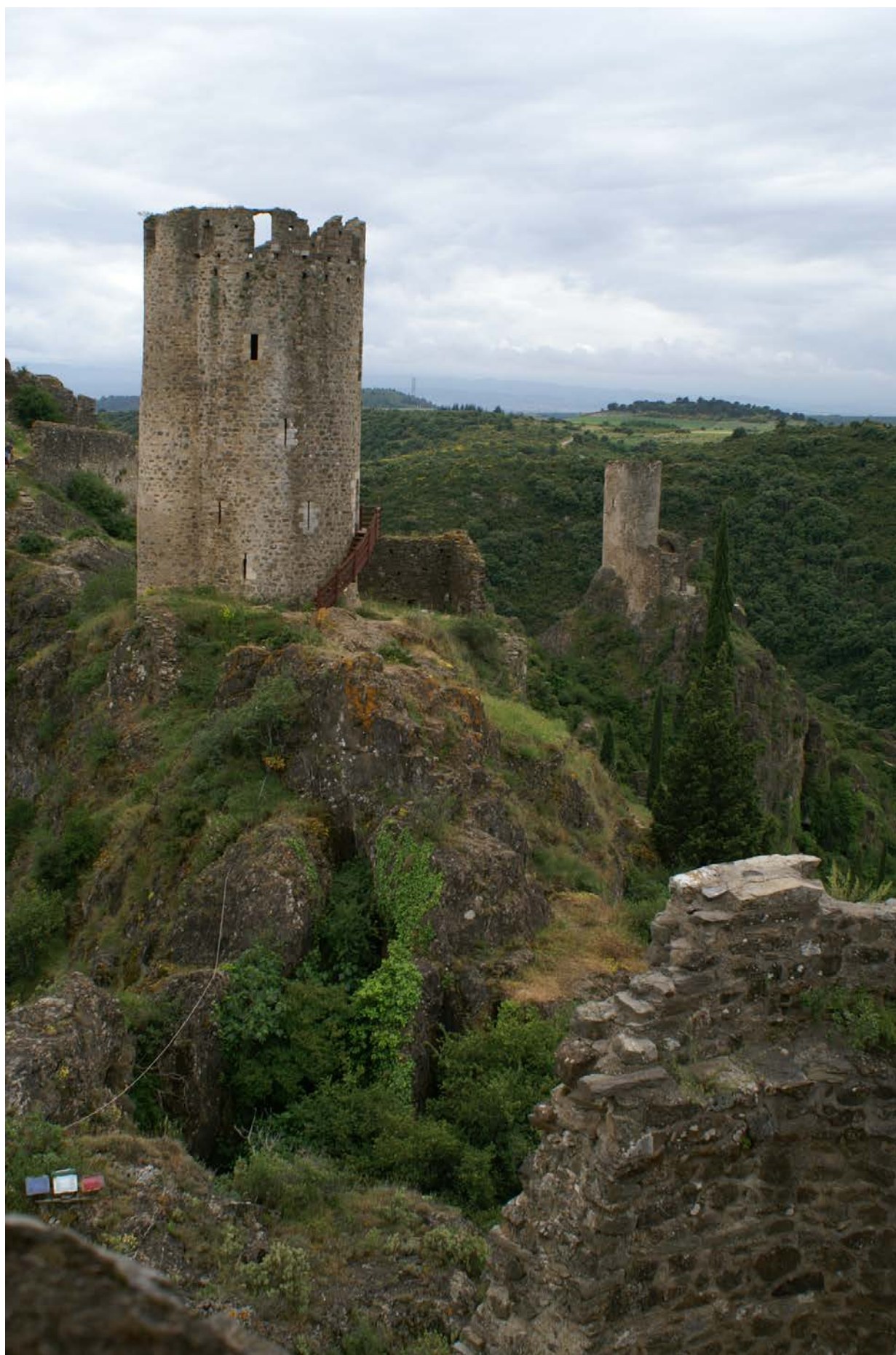
Châteaux de Lastours