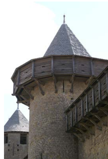
Cité de Carcassonne

Notre association a participé durant l'exercice écoulé aux Journées du Patrimoine et aux Journées généalogiques de l'EGMT. Nous y avons tenu un stand pour vendre nos publications et faire connaître notre association. Il faut que vous sachiez que les membres de notre association qui sont présents ces jours-là se déplacent à leurs frais et que les ventes ne sont pas toujours à la hauteur de l'effort fourni... Mais faire connaître notre association est à ce prix. Sans volontaires en nombre suffisant pour représenter notre association ces jours-là, nous ne pourrions assurer une présence sur ces manifestations.