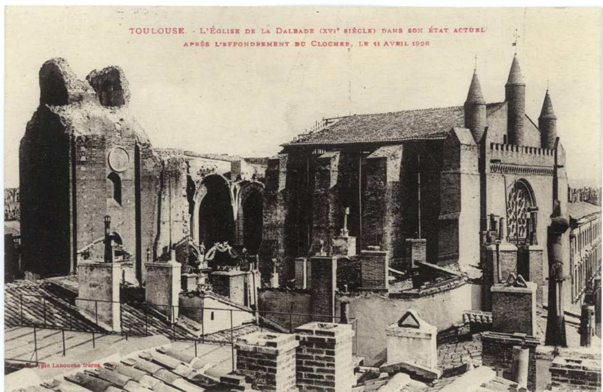
Effondrement du clocher de la Dalbade (11 avril 1926)