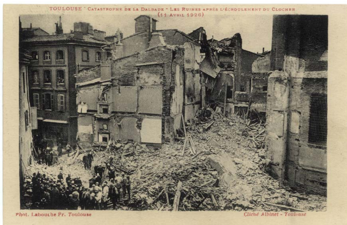
Effondrement du clocher de la Dalbade (11 avril 1926), ADHG 26 Fi 304